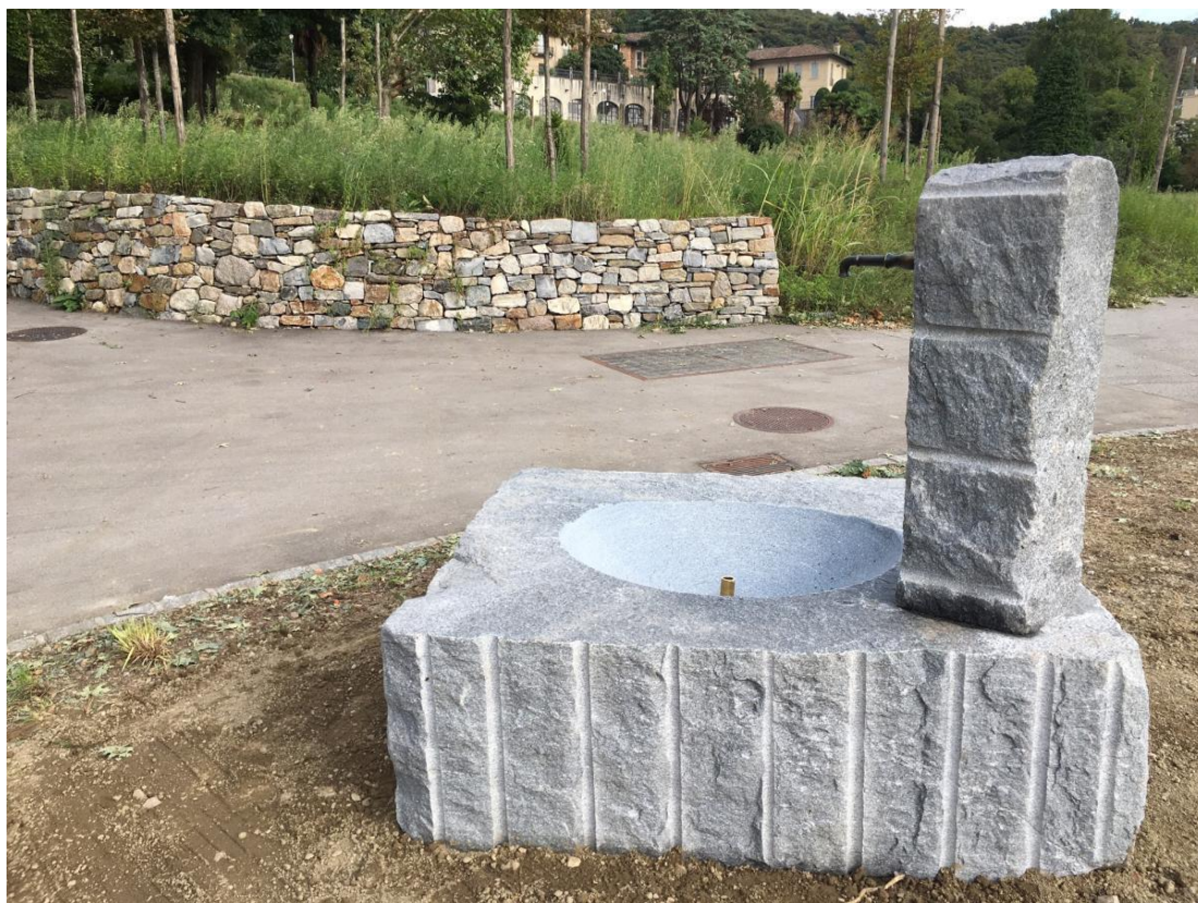
Nuova Fontana in via alla Cassina