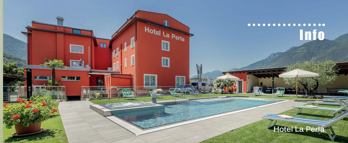
Hotel La Perla