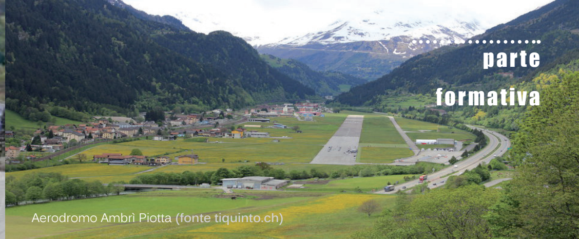
Aerodromo Ambrì Piotta