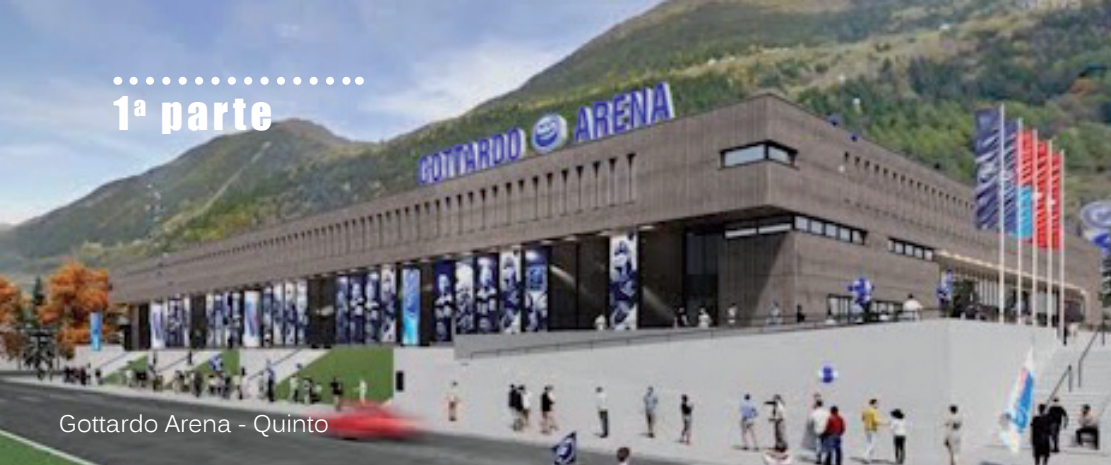
Gottardo Arena - Quinto