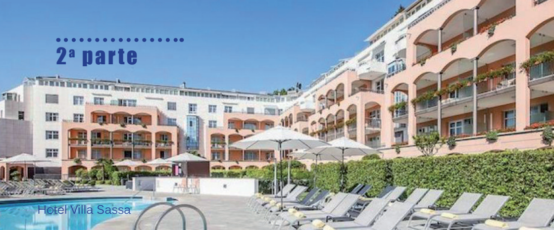
Hotel Villa Sassa